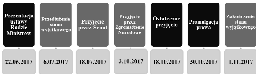
Rysunek 1. Kalendarium przyjęcia ustawy

Senat (Sénat) po akceptacji Assemblée Nationale, ostatecznie przyjął ustawę antyterrorystyczną w środę 18 października 2017 roku. Nowa regulacja została uznana jako „przekaznik” stanu wyjątkowego, który musiał się zakończyć 1 listopada. Ustawa przyjęta już tydzień wcześniej przez Zgromadzenie Narodowe, została przegłosowana przez 244 senatorów. Dwudziestu dwóch głosowało przeciwko, a pozostałych 82 wstrzymało się od głosu 51 . Ostatecznie Zgromadzenie Narodowe i Senat przyjęły ustawę, a Prezydent Republiki ogłosił nowe prawo. Promulgacja prawa miała miejsce 30 października 2017 roku, a ustawa weszła w życie 1 listopada 2017 roku, co było jednocześnie zakończeniem stanu wyjątkowego 52 (rys. 1).