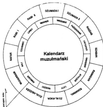
Rysunek 1. Kalendź muzulmański

Wyznawcy islamu stosują rok księżycowy, składa się na niego dwanaście miesięcy. Jest on krótszy od roku słonecznego o jedenaste dni, dlatego dzień rozpoczyna się wraz z zachodem słońca (rys. 1).